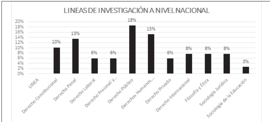
Gráfico 2 Líneas nacionales de investigación del Programa de Derecho