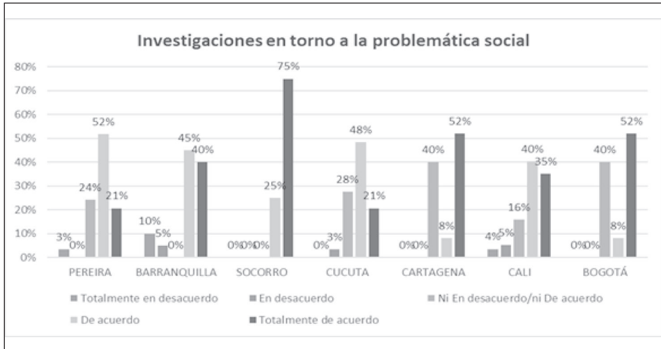
Gráfico 5 Percepción docente sobre las investigaciones desarrolladas por el Programa de Derecho en torno a problemas sociales